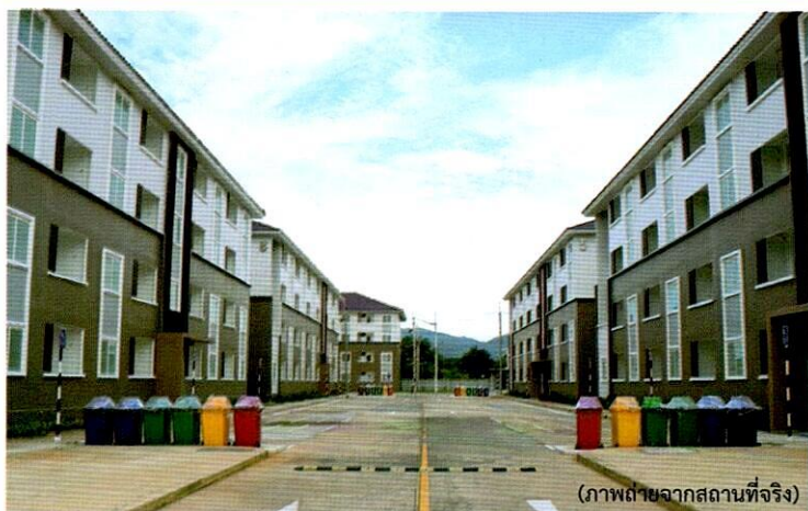
(ภาพถ่ายจากสถานที่จริง)

สามารถจองออนไลน์ได้ที่ http://house.nha.co.th