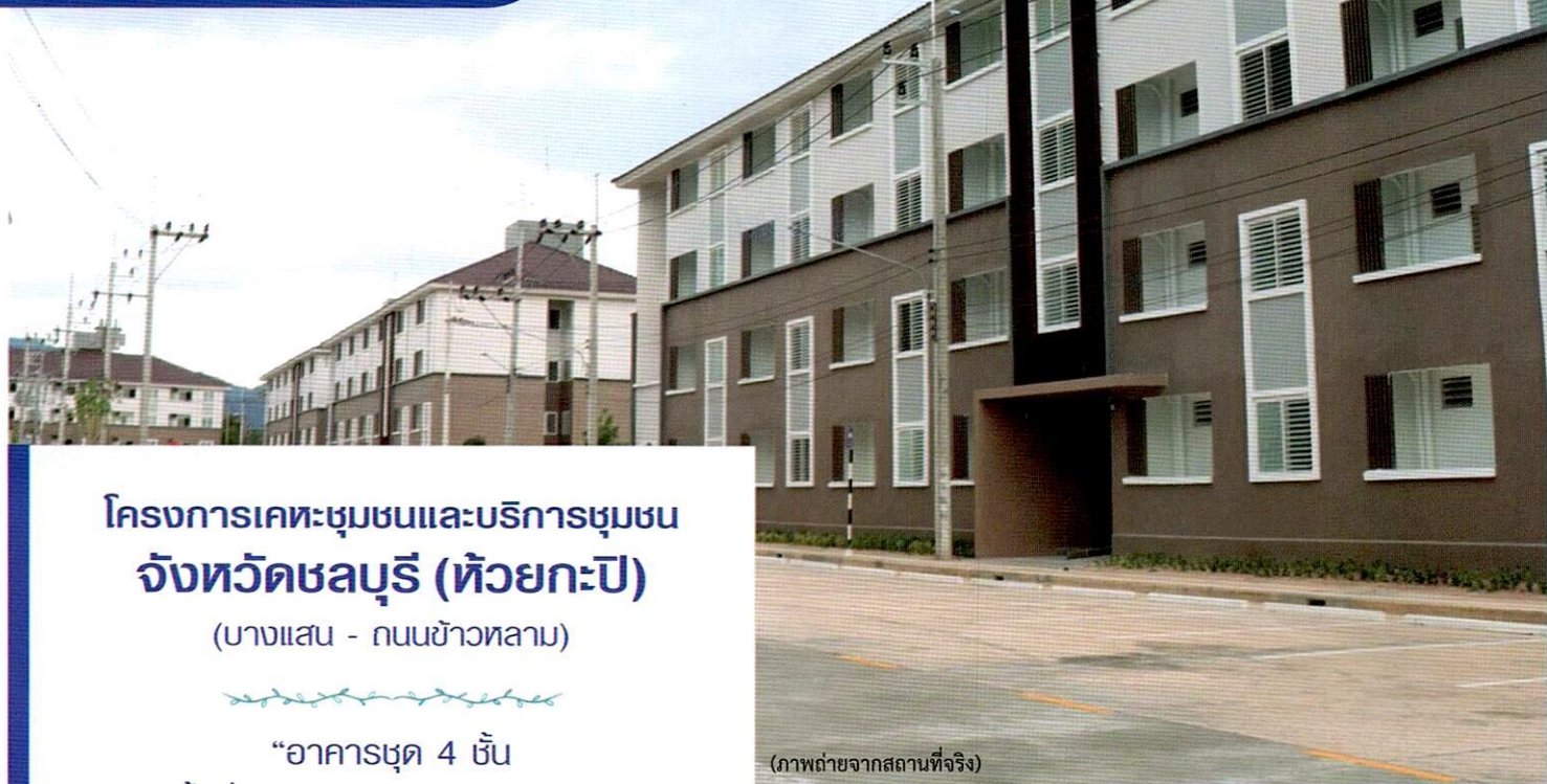
(ภาพถ่ายจากสถานที่จริง)