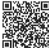
เพชบุรีโครงการ