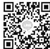
ไลน์กลุ่มผังน้ำ ลุ่มน้ำชายฝั่งทะเลตะวันออก