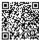
เอกสารประกอบการประชุม

รองเลขาธิการ ปฏิบัติราชการแทน เลขาธิการสำนักงานทรัพยากรน้ำแห่งชาติ